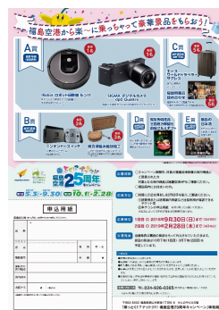
キャンペーンPRチラシ イメージ