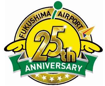
キャンペーンロゴ