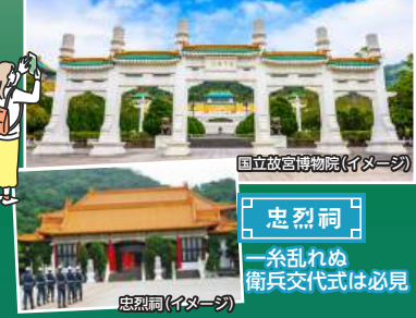
国立故宮博物院(イメージ)