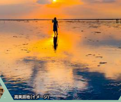
高美湿地(イメージ)