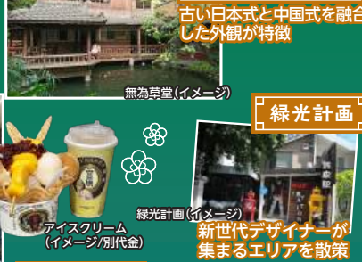
無為草堂(イメージ)