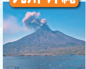
桜島 / 最寄: 鹿児島空港