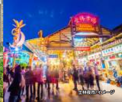
士林夜市/イメージ