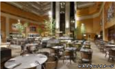
レストラン/イメージ

台湾最大級のラグジュアリーホテル。ロビーから17階までの吹き抜けとガラス張りのエレベーターは開放感いっぱい。