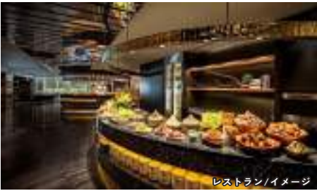
レストラン/イメージ

世界最高級のハイファッションブティックを多く擁したホテル。館内には一流シェフが腕を振るうレストランやスパ等充実した施設も魅力。