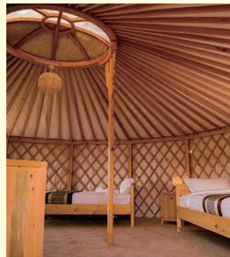
テレルジスターリゾート