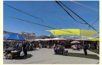
ナラントゥール市場