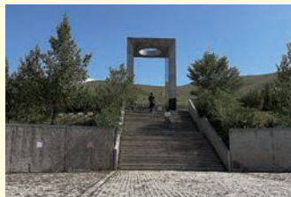
ダンバダルジャー慰霊碑