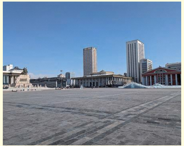
スフバートル広場(トゥーシンホテルが隣接されています)

査証(ビザ) /モンゴル滞在1か月以内の場合は査証は不要。パスポートの残存期間はモンゴル入国時6か月以上、査証欄見開き2ページ以上必要